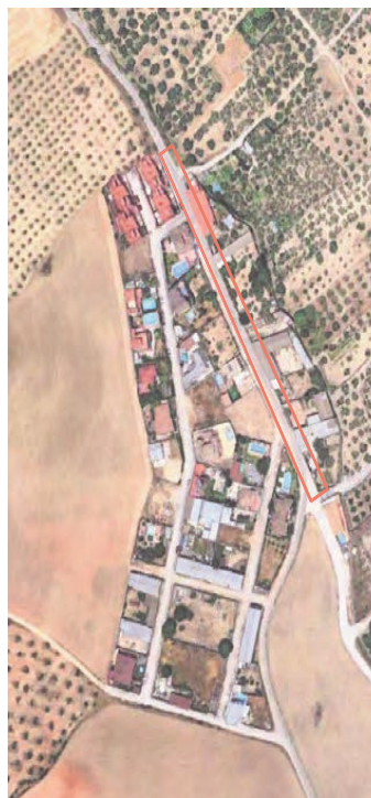
Ortofoto c/ Cerezos y c/ Camino Alto de Santa Fe

1. Finalidades del Estudio de Detalle según art. 71 LISTA y art. 94 RGLISTA: