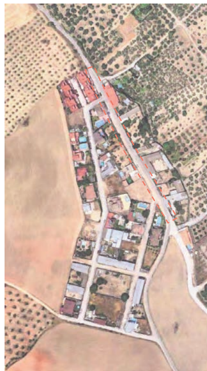
Ortofoto con indicación de la nueva alineación a definir